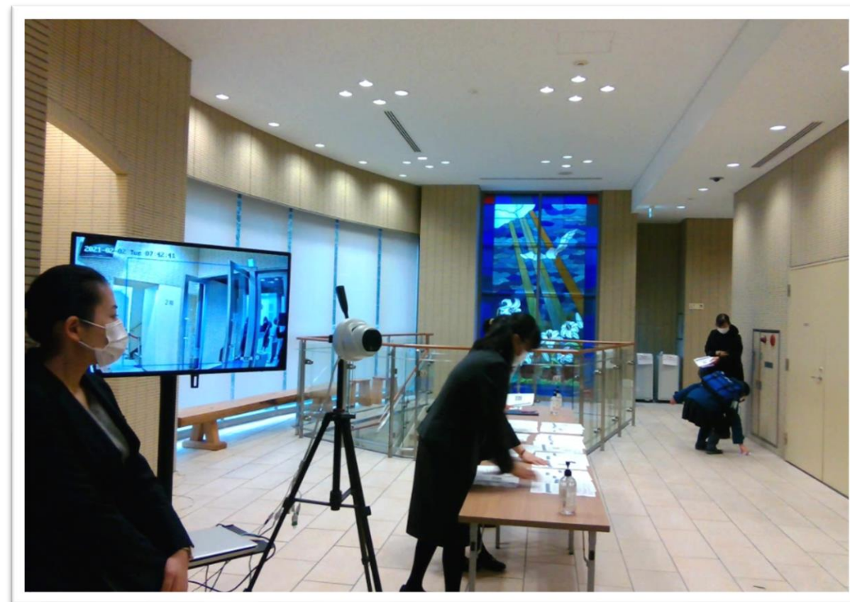
昨年度の2月2日入試の受付の様子